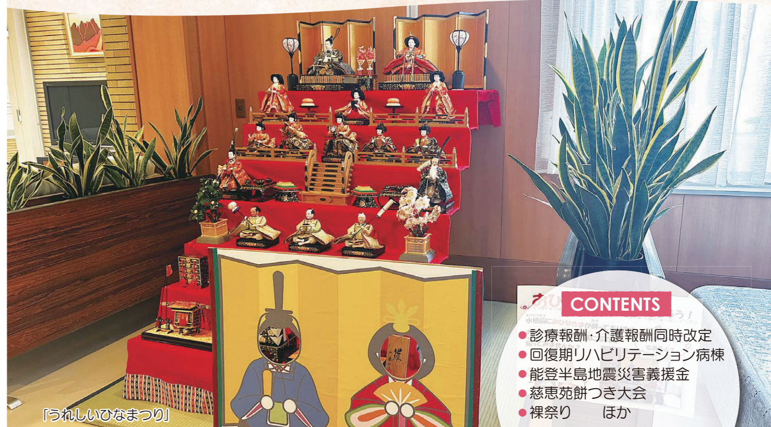
「うれしいひなまつり」